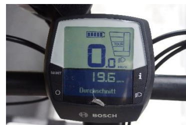
Anzeige mit Schalter für das Licht (rechts unten)