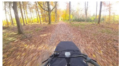
Lange Front mit großem Kurvenradius