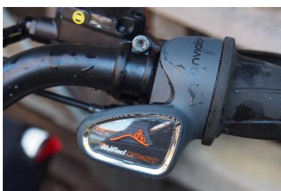
Schaltendrehgriff mit stufenloser Schaltung. Das Schalten im Stand ist nur eingeschränkt möglich! Drehgriff nicht mit Gewalt drehen und nicht unter Last schalten!