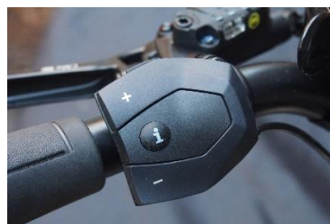
Hier kann die Motorunterstützung erhöht oder verringert werden